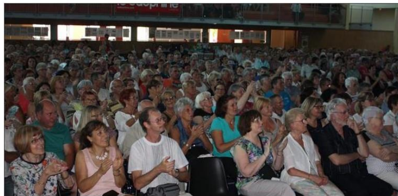
Le public est venu nombreux assister à ce concert humanitaire.