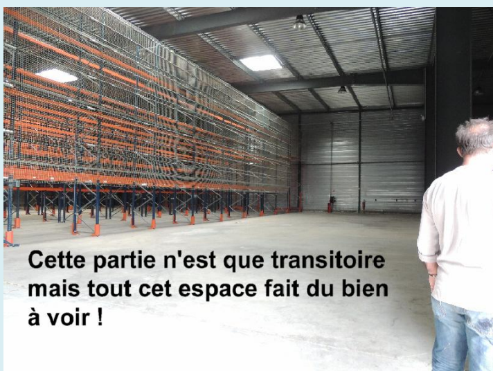
Cette partie n'est que transitoire mais tout cet espace fait du bien à voir !