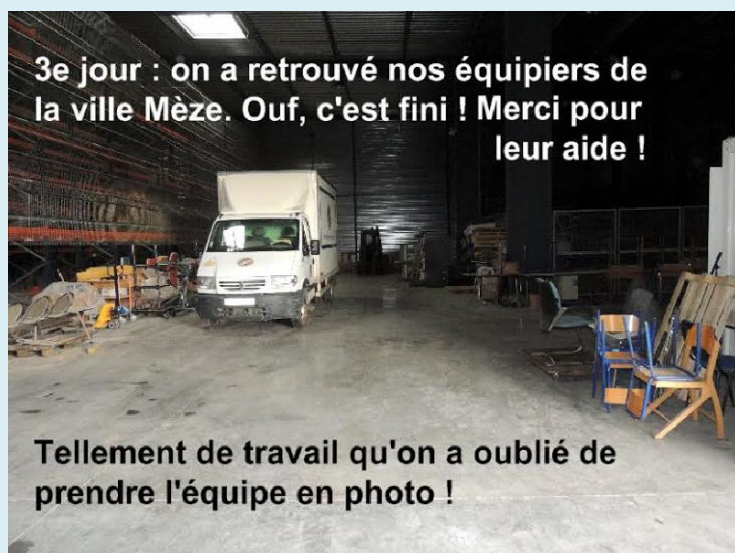
3e jour : on a retrouvé nos équipiers de la ville Mèze. Ouf, c'est fini ! Merci pour leur aide !