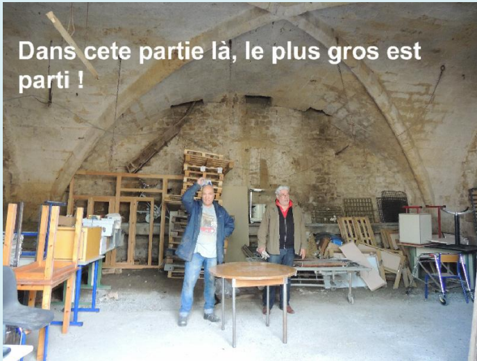
Dans cete partie là, le plus gros est parti !