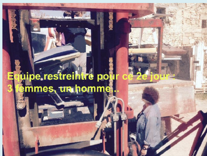
Equipe restreinte pour ce 2e jour : 3 femmes, un homme..