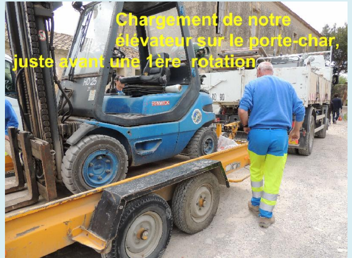
Chargement de notre élévateur sur le porte-char, juste avant une 1ère rotation