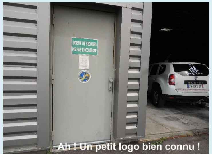
Ah ! Un petit logo bien connu !