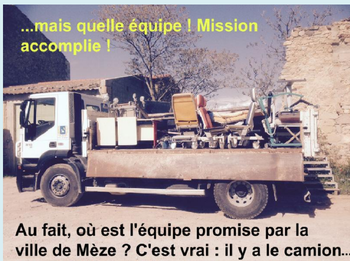
...mais quelle équipe ! Mission accomplie !