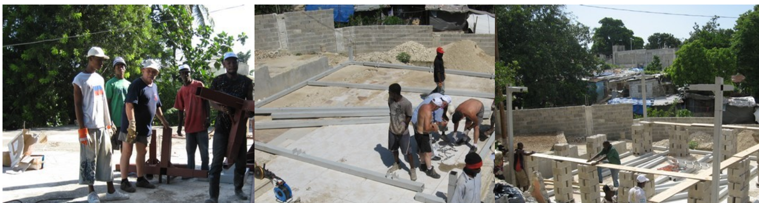
Photos - Tri des ferrures, préparation du montage et l'avancement du chantier.