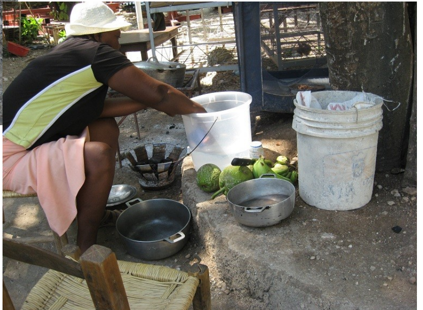
Photo - La cuisine des petits....

samedi 27 août 2011 - Effort sur la 2ème structure ...