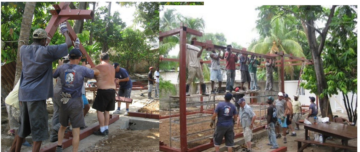
Photos - Ho - hisse, l'assemblage demande de la force, et ils en ont.