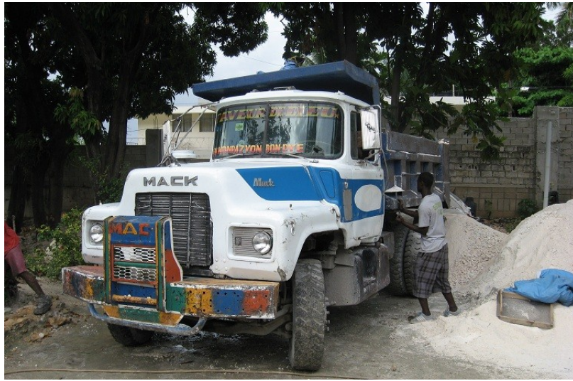
Photo - Livraison de sable, en fin de journée.

Mercredi 24 août 2011 - Sera un autre jour...