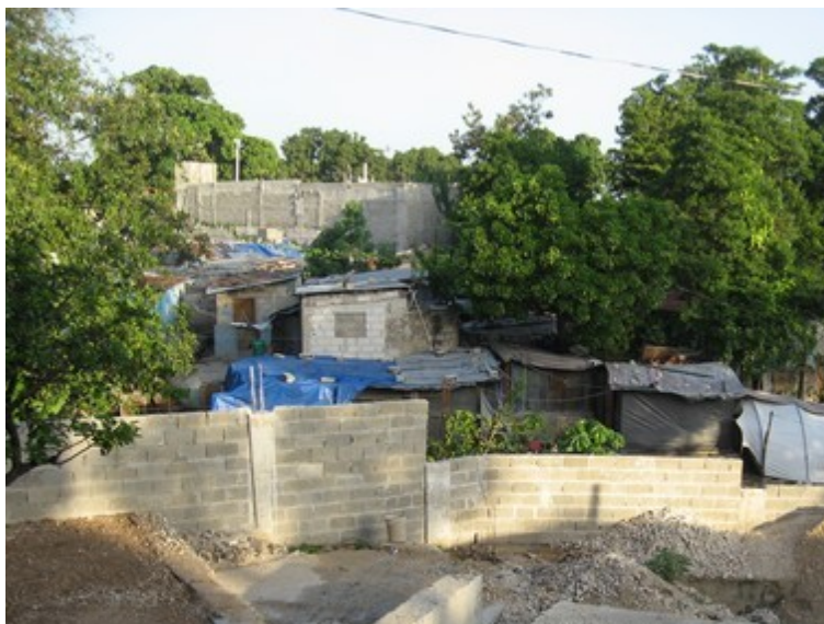
Photo - Préparation de la dalle, face à un des nombreux vidonvilles de Port-au-Prince

L'après-midi préparation de la dalle devant recevoir le bâtiment pour la crèche et tracé des fondations pour l'autre bâtiment. Un bon repas du soir, un bon sommeil réparateur et nous serons prêts pour demain.