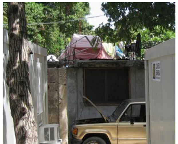
- Des tentes servent encore d'abri