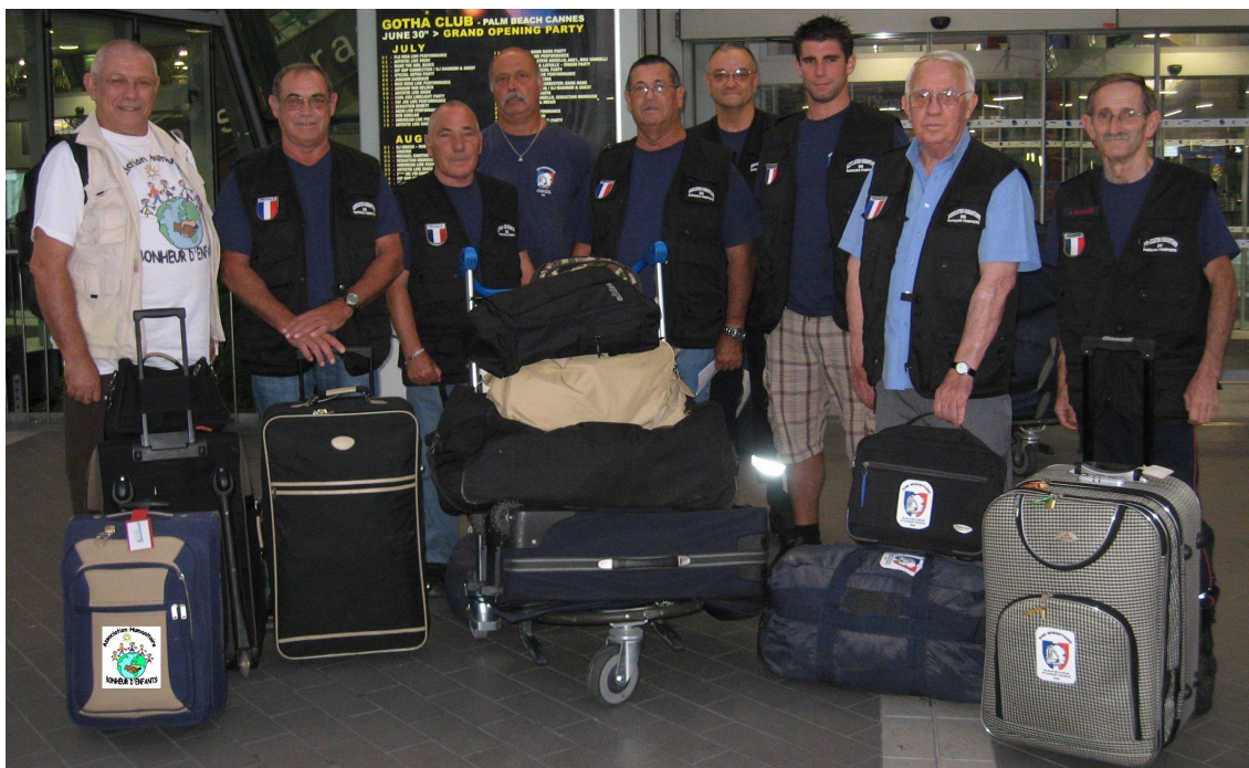
Photo – Le départ de Nice

Nous nous sommes retrouvés à l'aéroport de Nice à 6h30 ce matin. Prés pour un embarquement et un voyage de presque 18 h. Le voyage Nice – Roissy – Point à Pitre – Port au Prince s'est bien déroulé et c'est un peu fatigué que nous sommes arrivés à destination vers 18 h locale.