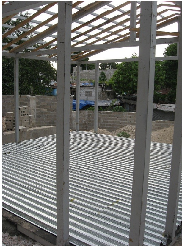
Photo - Fin de journée au 1er chantier