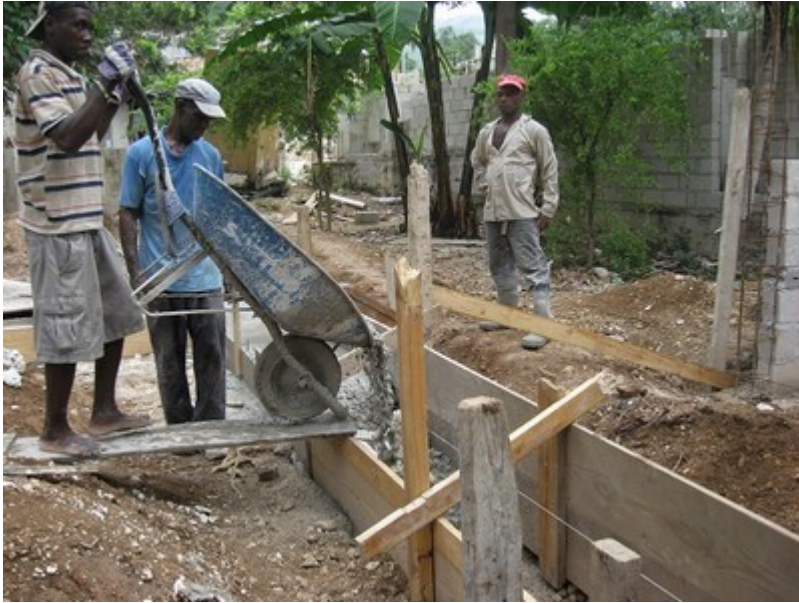
Photo - Les fondations avancent...et sont terminées ce soir