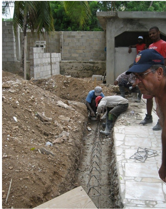
Photo - Début de coulage des fondation au 2ème chantier