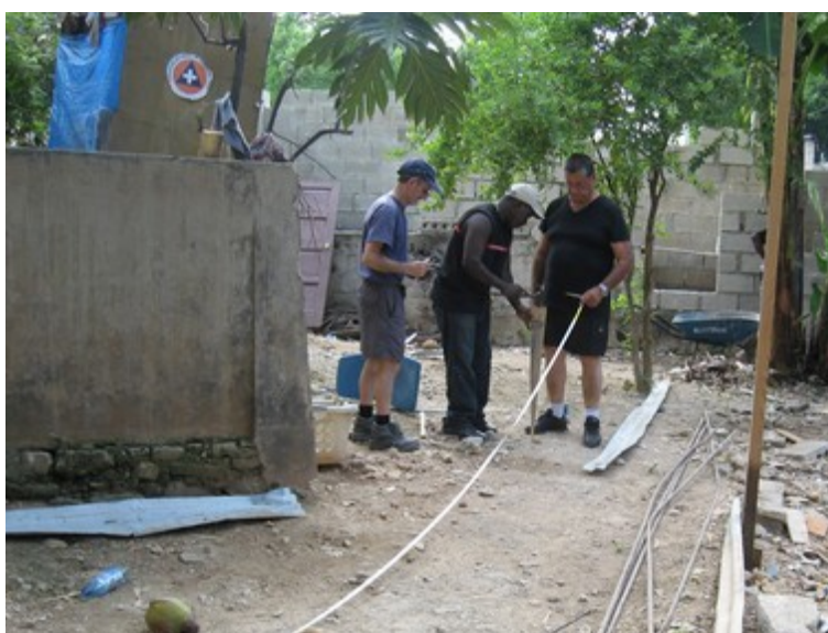
Photo - Mesures et marquages de la future tranchée de fondation de l'autre bâtiment