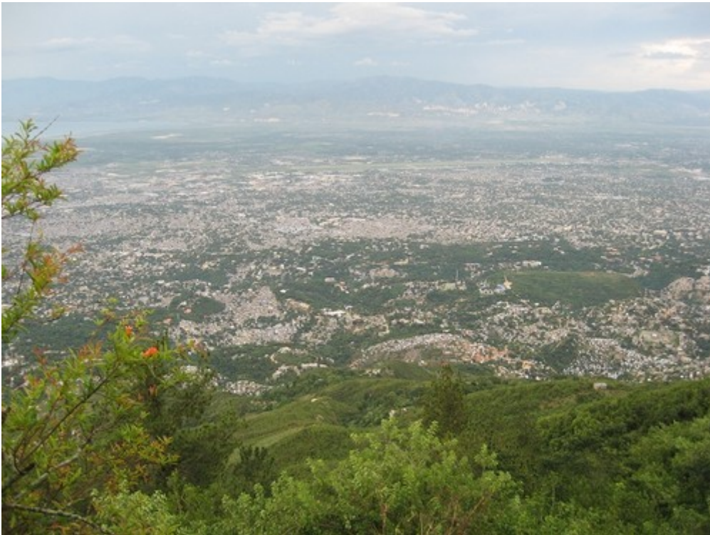
Photo - Point de vue sur Port-au-Prince