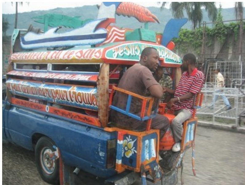
Photo - Un des moyens de transport en commun....