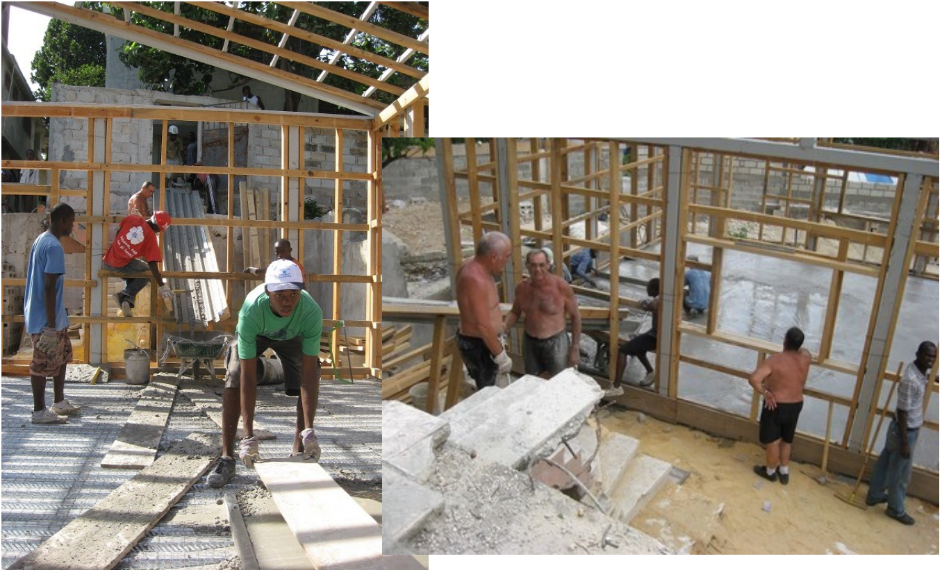
Photos - La dalle, ça coule - Début et fin

La journée de jeudi s'est finie comme elle a commencé, sans électricité, mais nous avons quand même eu les ventilos pendant la nuit, c'est tant mieux. Tout ça grâce au groupe électrogène qui a rechargé les batteries et dont le bruit nous a accompagné une partie de la nuit.