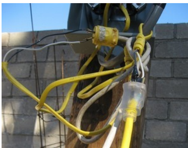
Photo - Grâce à cette installation pas très catholique, nous avons le 220V