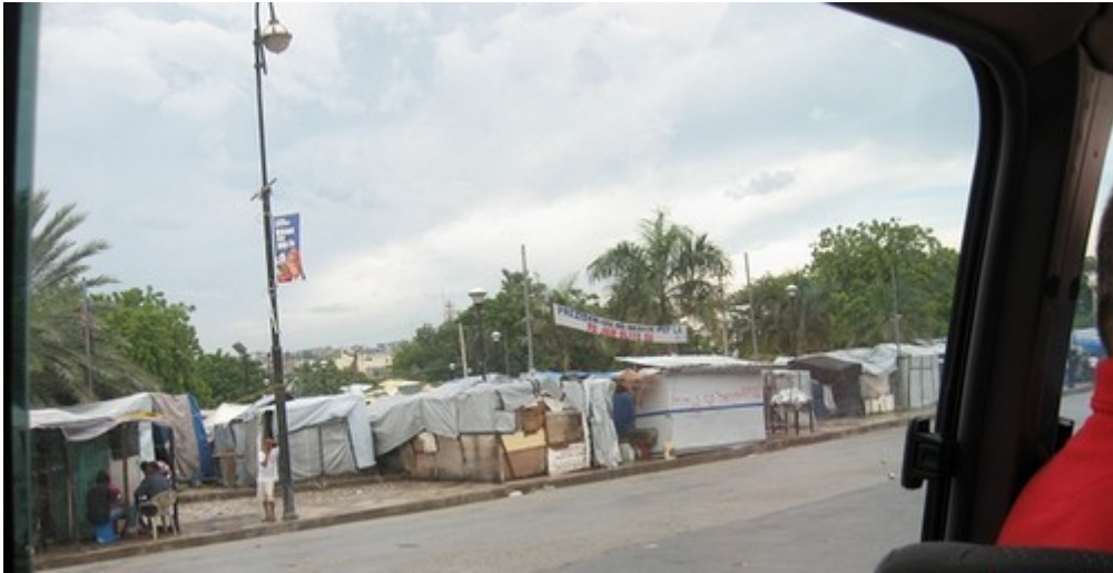
Photos - Le palais présidentiel et en face...