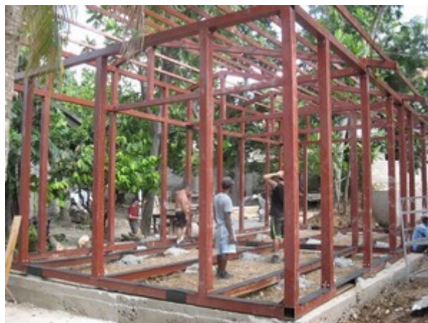
Photo - La structure de l'école est prête à recevoir les madriers

Photos - Le cocotier gêné, il est monté, il ne gêne plus...