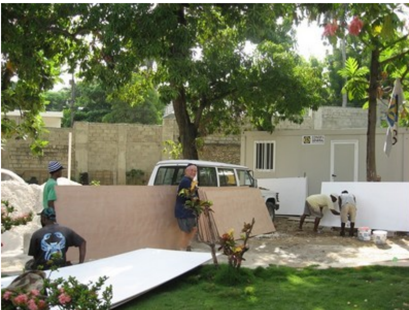
Photo - reprise de la peinture des plaques