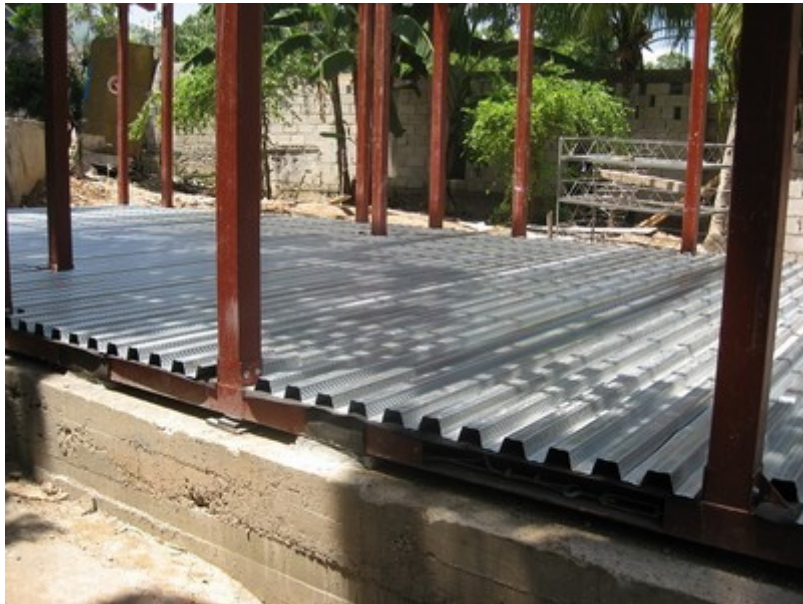
Photo - Le plancher fini de poser....