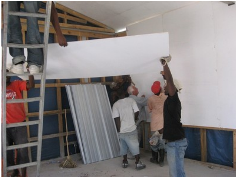
Photo - Mise en place de l'habillage intérieur de la 1ère structure.