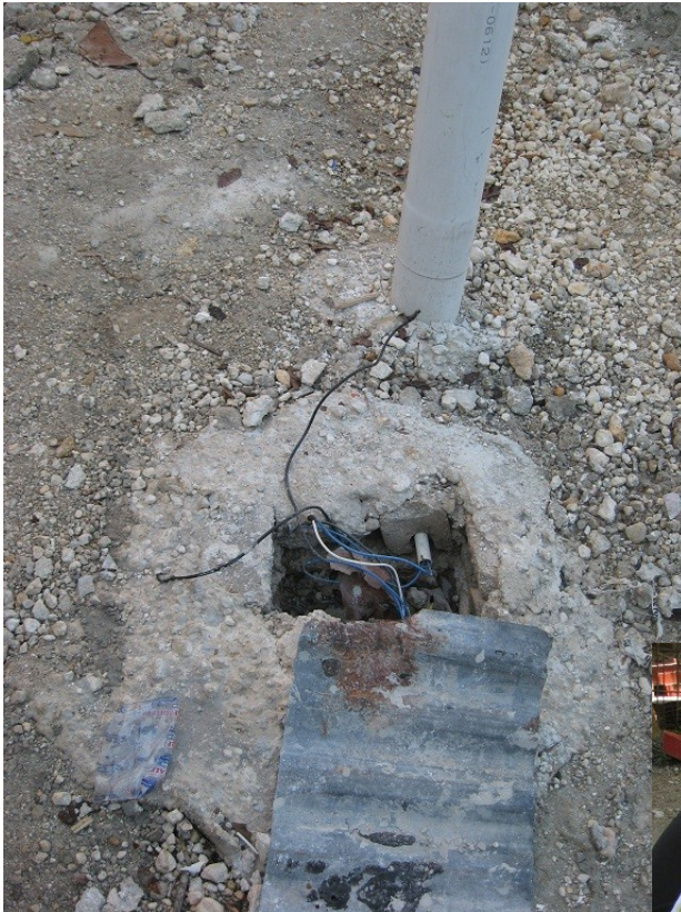
Photo - Un branchement électrique....