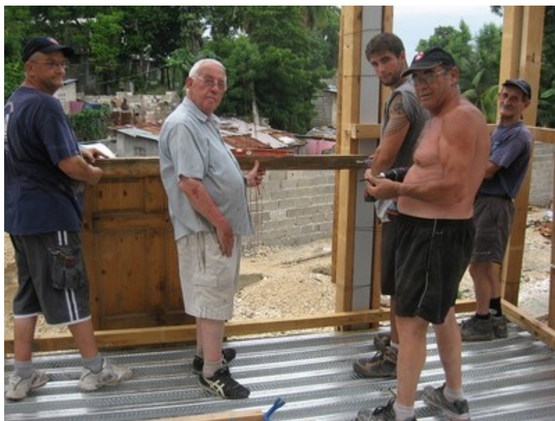
Montage des tasseaux de support....