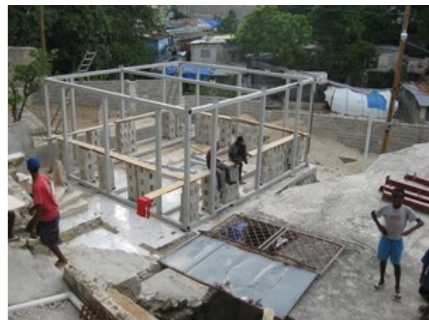
Photos - Avancement de la construction de la structure.