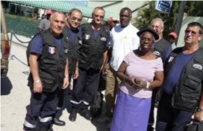
Photo - Une partie de l'équipe rentrante avec les responsables