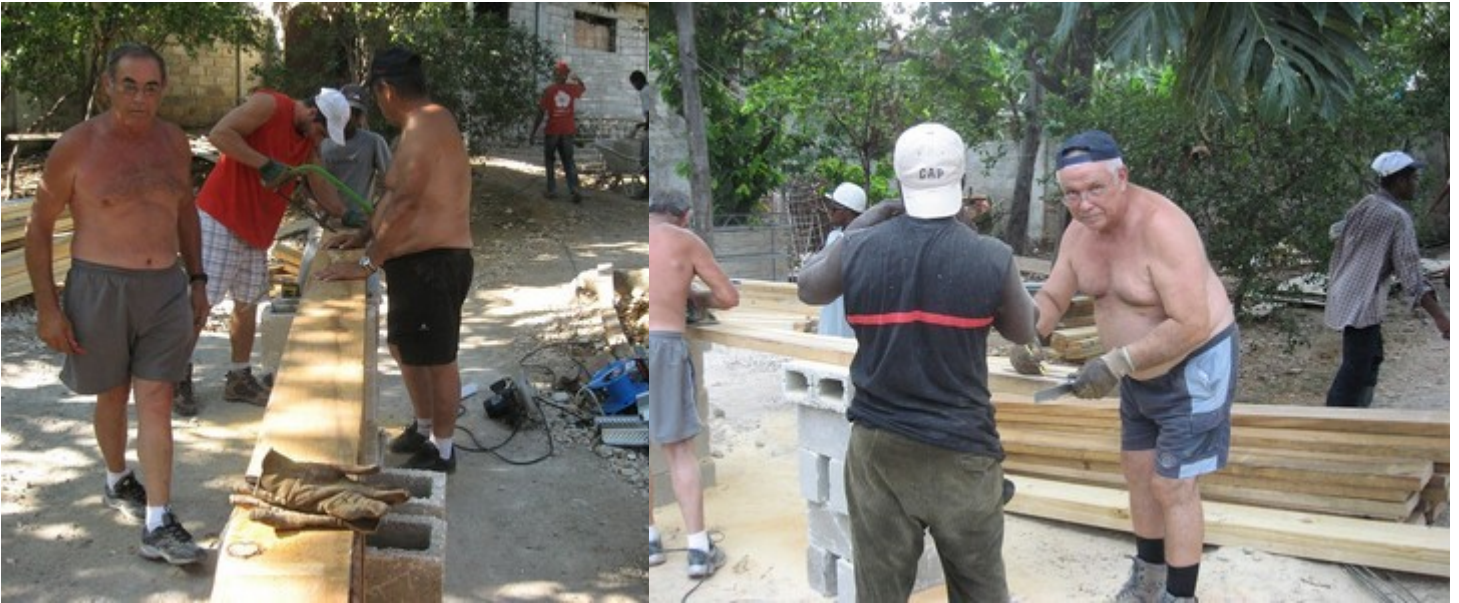
Photos - La scie manuelle nous a permis d'avancer. - Au traçage...

Pour la 1ère structure, le toit est presque fini et l'habillage de l'intérieur est bien avancé.