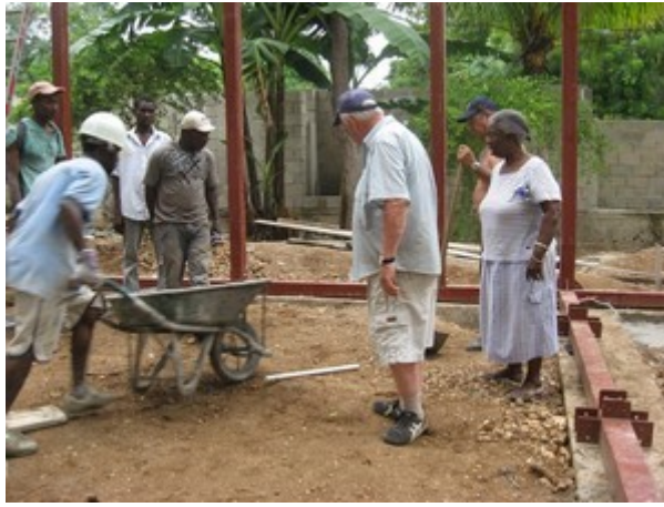
Photo - Fin de journée, tournée des chantiers