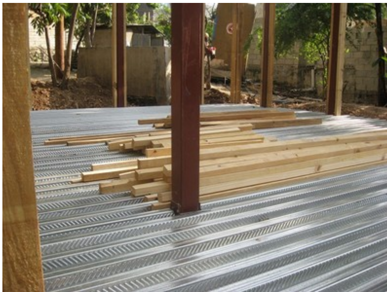
Photo - Le bois prépositionné pour demain matin