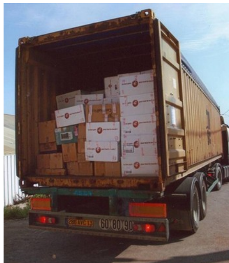
Photo - La fin du chargement du container avant départ

Un conteneur est parti en mai pour Port-au-Prince avec plein de matériel dont la structure métallique qui va être montée sur le terrain et le reste nous servira pendant la mission ou sera distribué sur place.