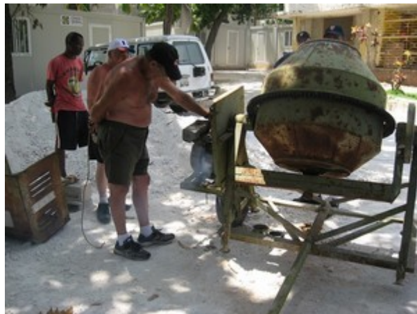
Photo - Essai de la bétonnière