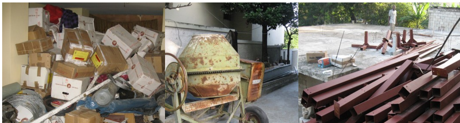
Photos – Inventaire et rangement du matériel arrivé

Le container a été déchargé sans nous et il nous faut faire l'inventaire du matériel, voir ce qui a disparu éventuellement. Le tri entre le matériel de chantier et ce qui est donné pour les enfants est fait et nous pouvons commencer les chantiers pour les 2 bâtiments.