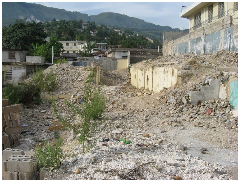
Photo - Terrain pour recevoir l'école, beaucoup de travail.

L'après-midi, nous avons visité Port-au-Prince, les photos témoignent....