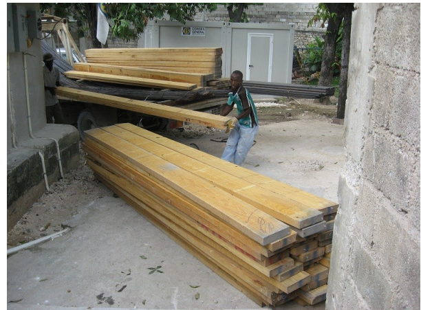
Photos- Déplacement de la bétonnière et livraison...