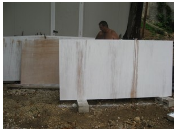
Photos - Mise en peinture des plaques de toit. Avant et après l'averse