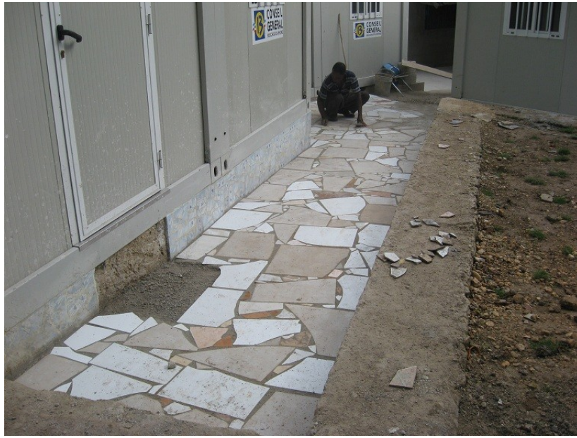
Photo - et pendant nos chantiers, les sols des allées sont carrelés....