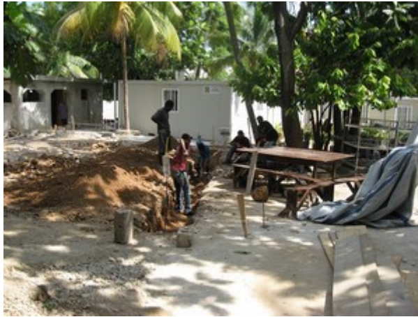
Photo - Avancement du creusement de la fouille pour le 2 ème chantier