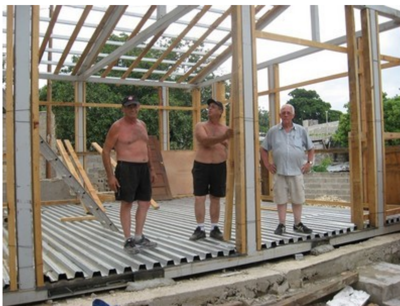
Photo - Fin de journée sur le 1er chantier....