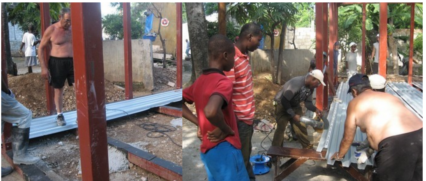
Photos - Positionnement de la 1ère tôle... - Curiosité pour la découpe