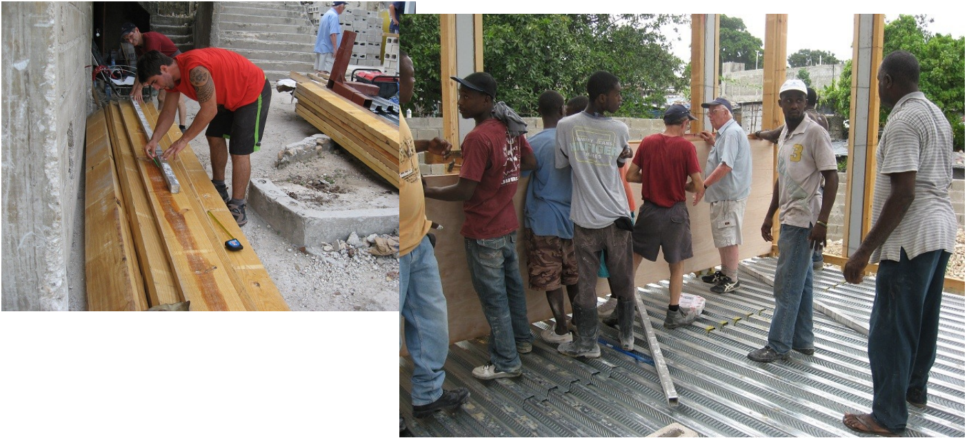
Photos - Préparation du bois et fin de journée au 1er chantier