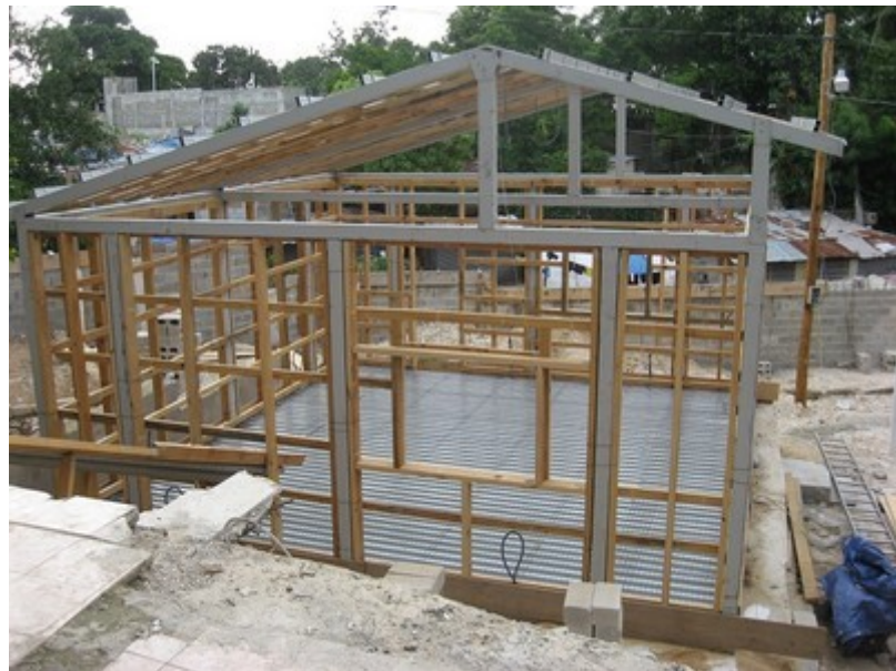
Photo - Demain, nous coulons la dalle

Photo - Les fondations avancent...et sont terminées ce soir