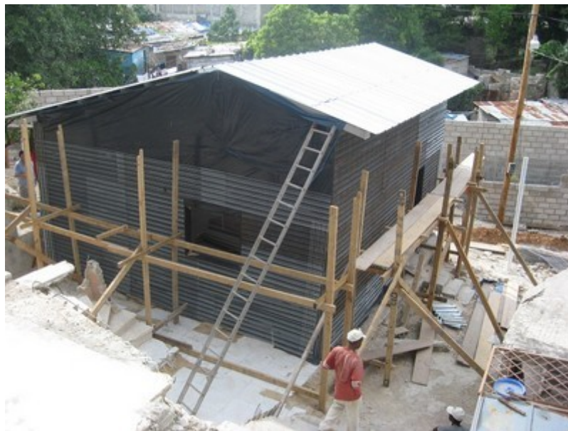
Photo - La 1ère structure prête à être crépie.

Cet après-midi, attente des bois pour les classes, attente du courant (pas de recharge possible des accumulateurs des outils portatifs), ce qui fait que nous n'avons pas fait grand chose. Mais quand même, la 1ère structure est prête à recevoir le crépi, les électriciens ont avancé dans leur tirage de ligne et le toit est presque couvert