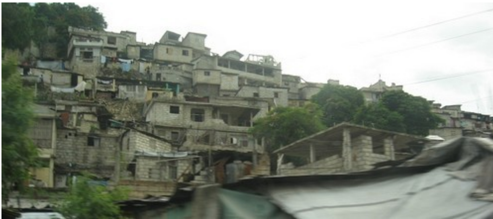
Photos - Scènes de la vie à Port-au-Prince....