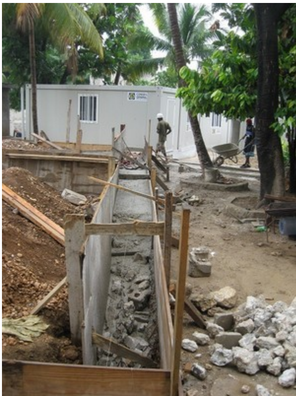
Photos - Les fondations avancent....