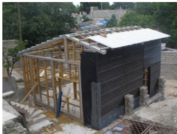
Photos - Préparation des murs pour recevoir un crépi et début de pose du toit